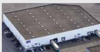
Hörmann Flexon, Leetsdale PA, США

Hörmann – единственный производитель на международном рынке, предлагающий «из одних рук» все основные строительные элементы, которые изготавливаются на высокоспециализированных предприятиях в соответствии с новейшими техническими достижениями. Имея широкую торговую и сервисную сеть в Европе и представительства в Америке и Китае, Hörmann является надежным поставщиком высококачественных строительных конструкций. Hörmann – качество без компромиссов.