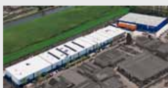
Hörmann Alkmaar B.V., Нидерланды