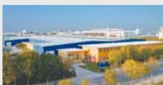
Hörmann Beijing, Китай