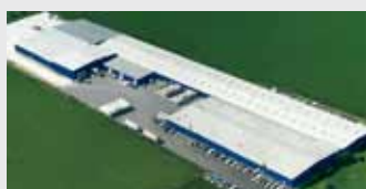
Hörmann LLC, Montgomery IL, США